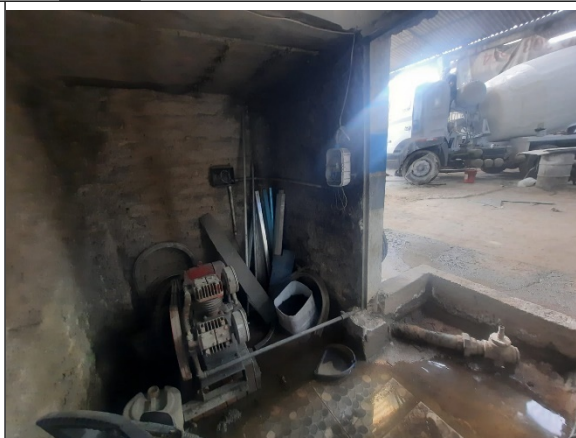
Foto No. 6 Vista interna