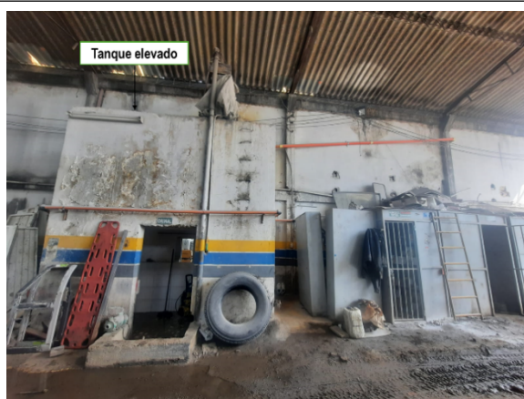
Foto No. 5 Vista cuarto de máquinas