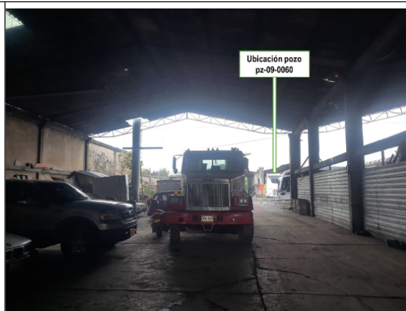
Foto No. 2 Vista interna del predio