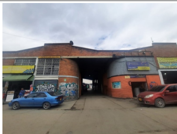
Foto No. 1 Fachada del predio

El día 17 de mayo del 2024 se realizó visita de control en la Avenida Calle 17 No. 72-35 con el fin de verificar las condiciones actuales del pozo identificado como pz-09-0062 (Foto No. 1 y 2), el cual se sitúa al costado sur del predio, en el cuarto de máquinas de la bodega en la que opera la empresa Inversiones Hecsa S.A.S. (Foto No. 3 y 4).