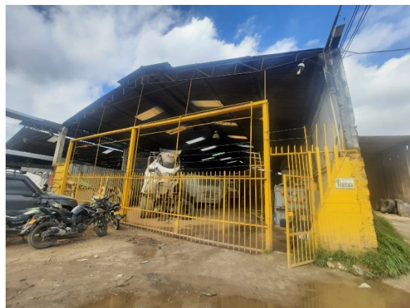
Foto No. 3 Bodega Inversiones Hecsa