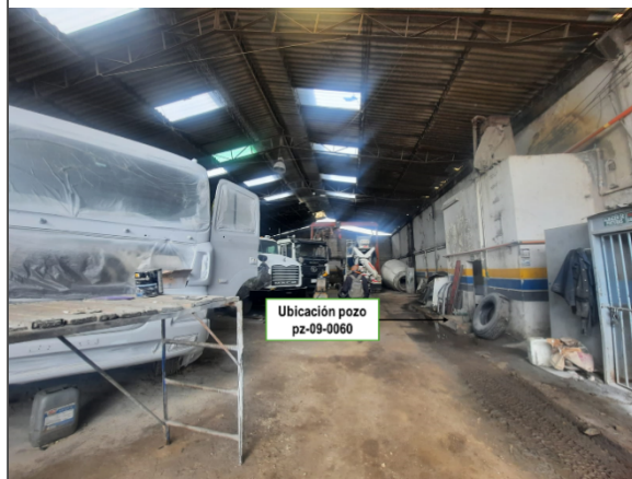
Foto No. 4 Vista interna bodega

El punto de aguas subterráneas se sitúa al ingreso del cuarto de máquinas, en donde se observa la tubería de producción deshabilitada. Las condiciones físicas y ambientales alrededor de la captación no son buenas, toda vez que hay acumulación de agua y está expuesto a un eventual riesgo de contaminación por sustancias o residuos propias de las actividades que se desarrollan en el lugar (Foto No. 5, 6 y 7). El pozo no cuenta con placa de identificación ni georreferenciación.